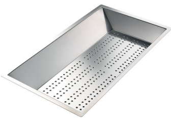
Cuvette perforée en acier inoxydable 8151 000 * uniquement en combinaison avec l'accessoire 8644 101