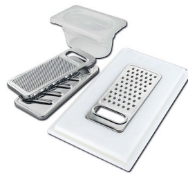
Kit râpes avec anneau de support et cuvette 8159 101 * uniquement en combinaison avec l'accessoire 8644 101